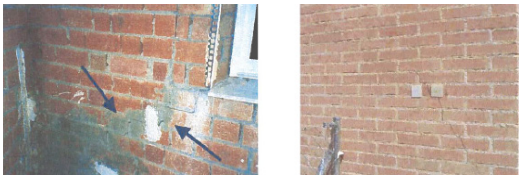
Fig 1.- Tipos de testigo: mediante yeso y elongómetro.

Para medir la anchura de las fisuras se emplean escalas sobre cartulina plastificada (fisurómetros). Una vez realizado el estudio correspondiente y tomadas las medidas correctivas oportunas, en caso de ser necesario reparar podemos optar por diferentes soluciones, que no deben realizarse con un simple mortero de cemento, ya que podría fisurarse también y desprenderse.